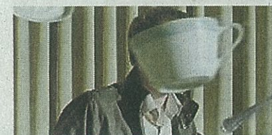
Sein Gesicht zeigt Liedermacherphilosoph Peter Licht nur bei Konzerten.

Peter Licht, Träger des Publikumspreises beim Ingeborg Bachmann-Preises 2007 und stets gern gefeierter Wortkünstler, setzt dabei ganz auf die Mischung von alten und neuen Titeln. Musikalisch geht es ruhig zu bei den ersten Nummern „Begrabt mein iPhone an der Biegung des Flusses“ oder auch „Das Ende der Beschwerde/Du musst dein Leben ändern“, doch nach und nach komplettiert sich die vierköpfige Band und drückt nachhaltig auf das Gaspedal. Gassenhauer und Liebhabsstücke wie „Safarinachmittag“, „Wettenentspannt“ und ja, auch das nicht klein zu kriegende „Sonnendeck“ (anständigerweise in die Zugabecke gepackt) fehlen dabei nicht und machen die Andachtsstimmung komplett. Auch wenn man dabei schmissig mitwippen kann. Denn Licht gibt sich tanzbar, mit rockigen Ausflügen in Richtung Diskothek und so üppig arrangiert wie selten zuvor. Konsum- und Gesellschaftskritik spielen zwar immer noch tragende Rollen in den Texten, aber der Melancholie über die Missstände und Missverständnisse des Lebens hat Peter Licht diesmal ein buntes T-Shirt angezogen. Und das steht der Sache wirklich gut. bema