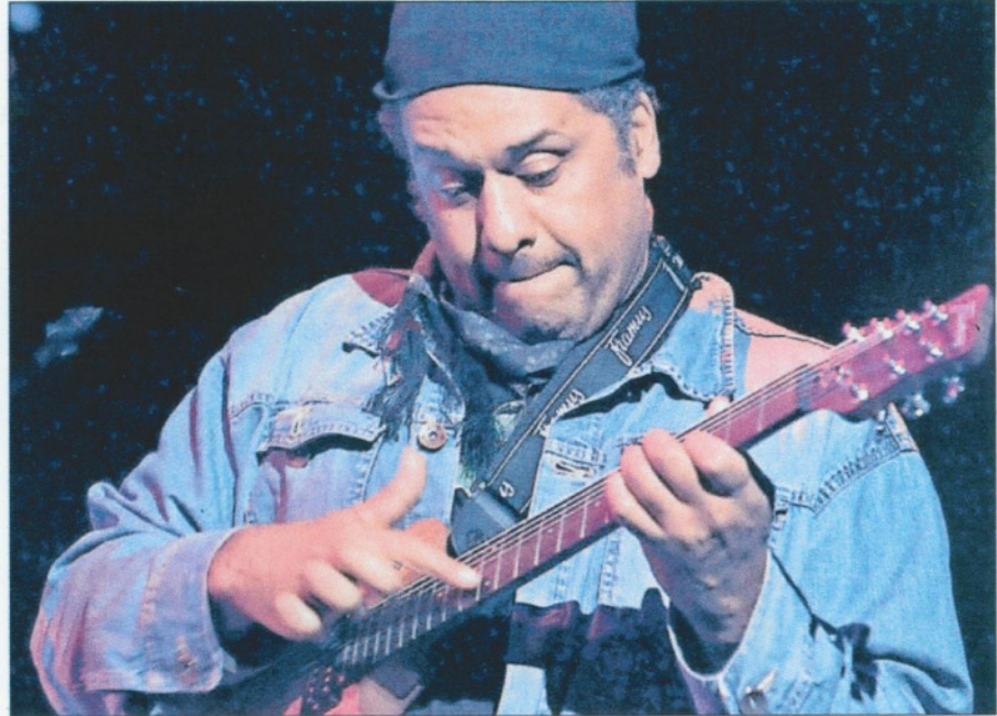
Gitarrist Jean-Paul Bourelly (großes Foto) und Trompeter Enrico Rava (links oben) hatten ihre Auftritte in der Alten Feuerwache in Mannheim, Flötist Henry Threadgill im Ludwigshafener Kulturzentrum Das Haus.